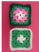
参考見本一例 (サイズ約13×13cm) 色は選べません。