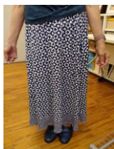
(見本例:ワンピースからスカートへ)